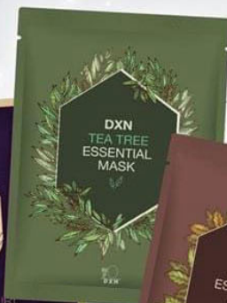
DXN TEA TREE ESSENTIAL MASK