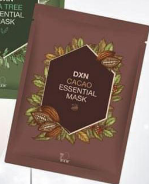
DXN CACAO ESSENTIAL MASK