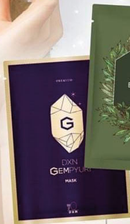
DXN GEMPYURI MASK